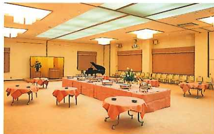
コンベンションホール「赤富士」 Convention Hall "Aka Fuji"