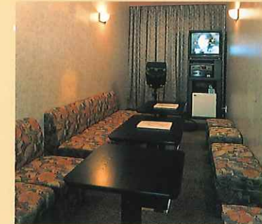
カラオケルーム Karaoke Room