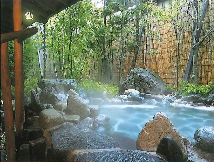
庭園露天風呂・女性(1階) Garden Style Open-air Bath・Ladies (1F)