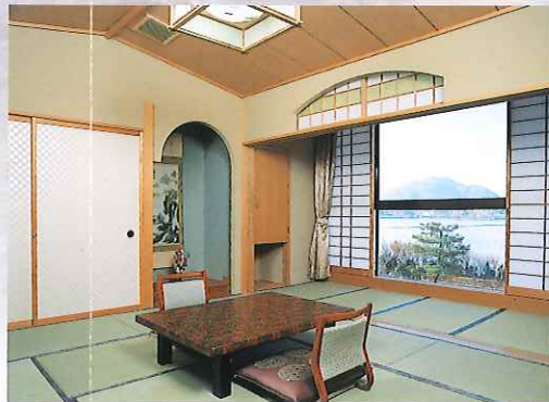
客室「和室」Guest Room "Japanese Style"

Enjoy fragrances of wild flowers, dancing with breeze. Looking up the majestic figure of the cloud in the sky. Be satisfied with your stay in easy and slow atmosphere.