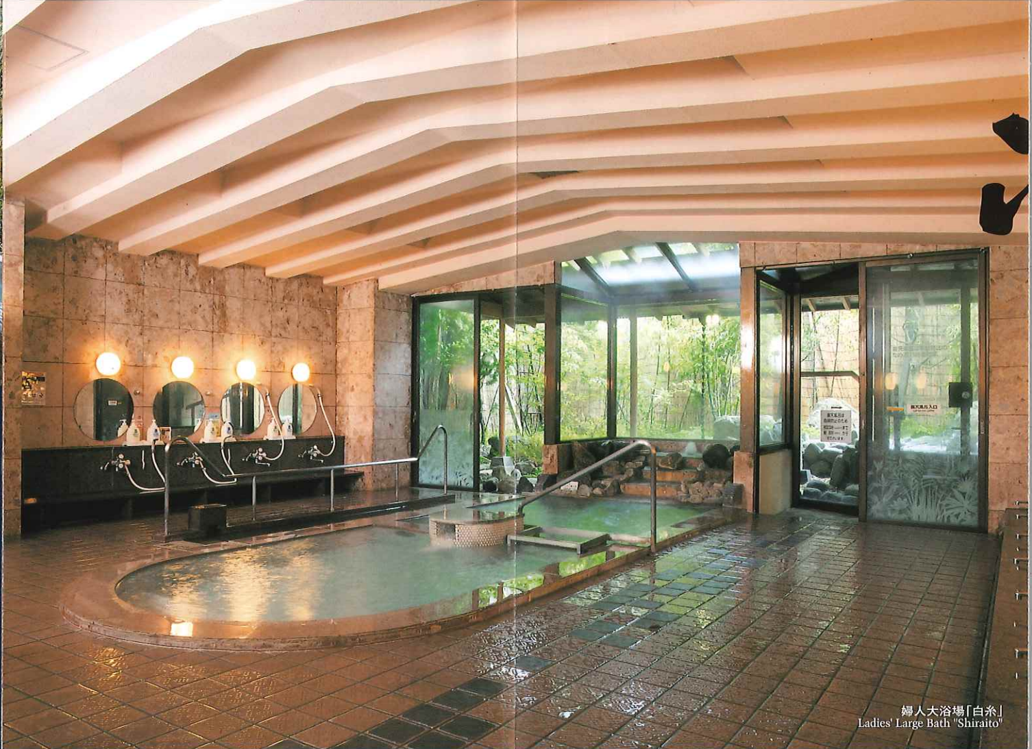
婦人大浴場「白糸」 Ladies' Large Bath "Shiraito"