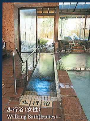
歩行浴 歩行浴(女性) Walking Bath(Ladies)