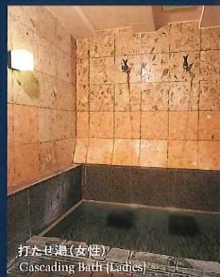
打たせ湯(女性) Cascading Bath(Ladies)