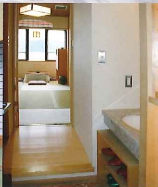
客室「和室」シャワールーム付 Guest Room "Japanese Style" with Shower Room