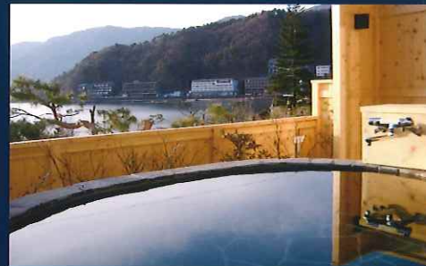
客室「和室」露天風呂付 Guest Room "Japanese Style" with Open-air Bath

Peaceful moment continues. Feeling the lake so close.