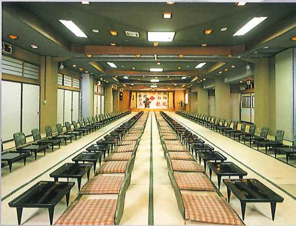
大広間「けやき」168畳200名様収容 Banquet Room "Keyaki" 168 Tatami Size 200 People Accommodated