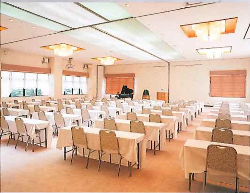
コンベンションホール「赤富士」 Convention Hall "Aka Fuji"