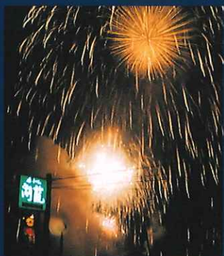
花火大会 Firework Festival

毎年8月5日、7月第1土曜日、1月2月の 土日の夜に開催される花火大会を 当ホテルよりご覧いただけます。