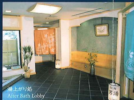
湯上がり処 After Bath Lobby