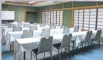
中会議室 Middle Size Conference Room