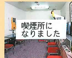
喫煙所になりました