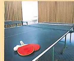
卓球場(2台) Table Tennis (2 sets)